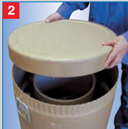
2 Klebestreifen abziehen und Deckel öffnen.