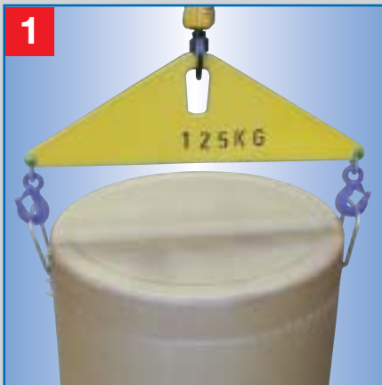
1 Bitte beachten! Nur an den Metallgriffen heben.