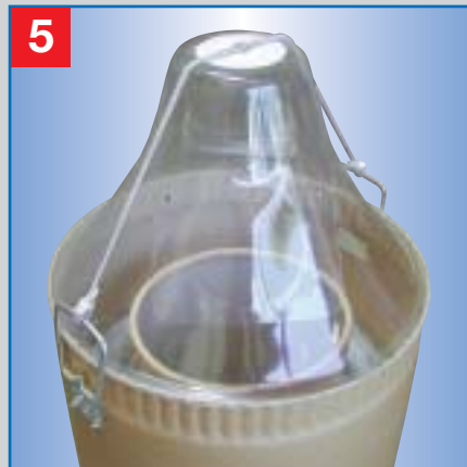
5 Das gewünschte Entnahmesystem (Haube, etc.) aufsetzen und mit elastischen Spanngurten befestigen.