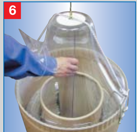
6 Durch die Haubenklappe greifen und den Drahtanfang im Haubentop einführen.