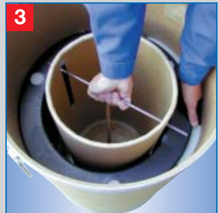
3 Transportsicherung (Metallstab) lösen und in den Fassboden fallen lassen, gepolsterten Transportring entnehmen.