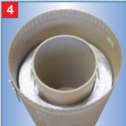
4 Exaktwicklung des Drahtes liegt frei zur jetzigen oder späteren Entnahme.